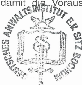
(Haas) Rechtsanwalt und Notar · Fachanwalt für Steuerrecht Leiter des Fachinstituts für Steuerrecht